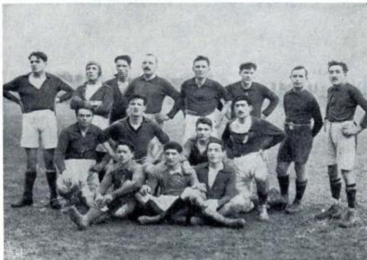
En 1922 : L'EQUIPE DE RUGBY

Les matches se déroulent au stade de l'avenue René-Gasnier, alors rue Saint-Lazare, dont le tracé était inversé par rapport à celui d'aujourd'hui.