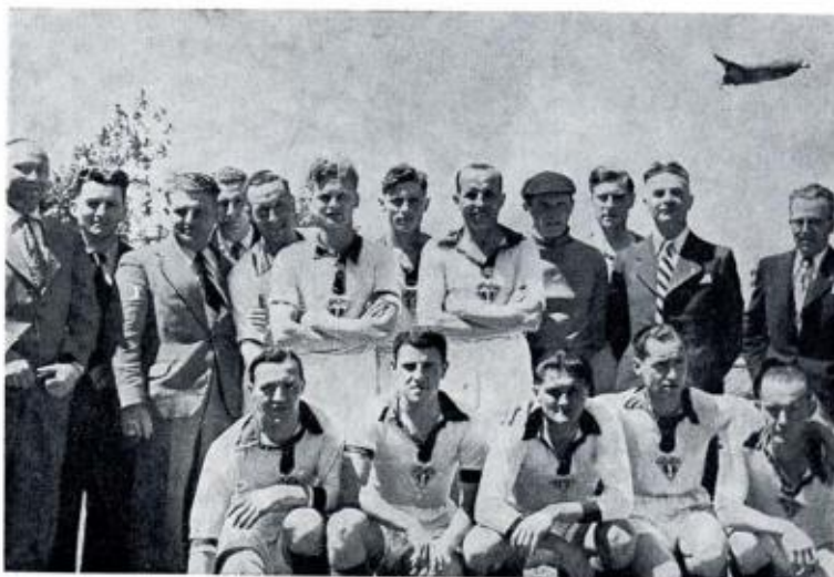
L'Equipe de Football 1943 qui a remporté le titre de Championnat de France Amateur