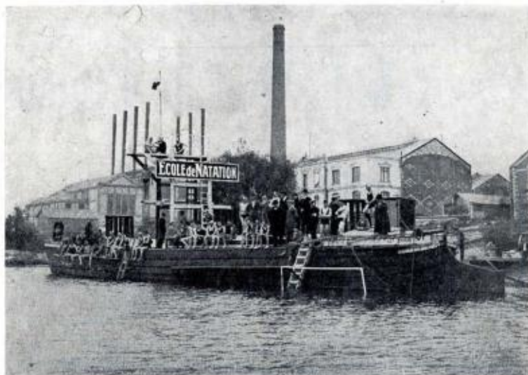
La première installation de baignade

En 1923, à Tours, dans la Loire, succès du S.C.O. sur 400 mètres.