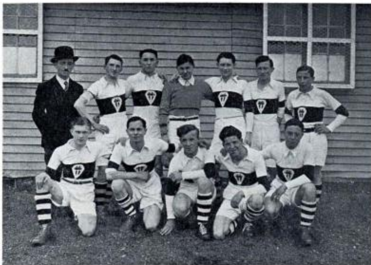
L'Equipe Junior de 1932-1933

« La conversation que nous eûmes tous quatre dans mon bureau fut, par moment, si émouvante que de ma vie je ne l'oublierai. Avec une loyauté intense et une largeur de vue extrême, je fus mis au courant des décisions des Etablissements Bessonneau concernant la nouvelle orientation du C.S.J.B., dont l'équipe d'association était championne de l'Ouest de Division d'honneur. Pour l'amour du sport et l'intérêt de la ville d'Angers, ils étaient prêts à servir dans nos rangs si nous voulions bien les accueillir.