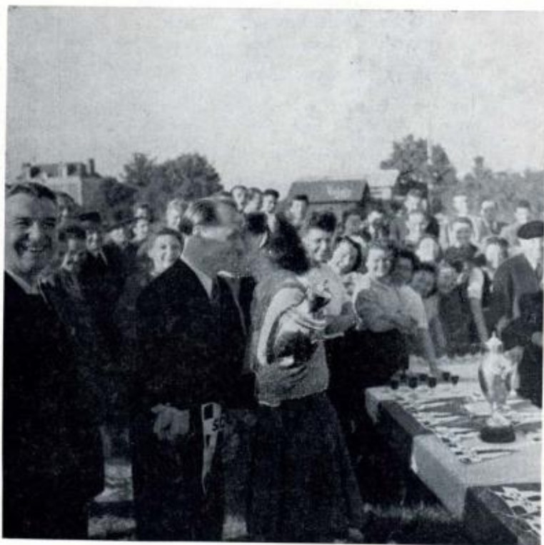
Section de Hockey, en 1945