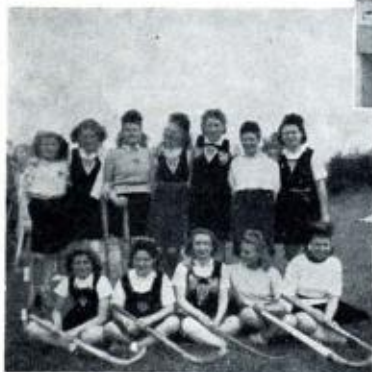
Les Equipes Féminine et Masculine de Hockey, en 1945