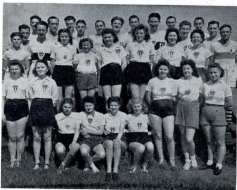
La Section de Basket en 1942