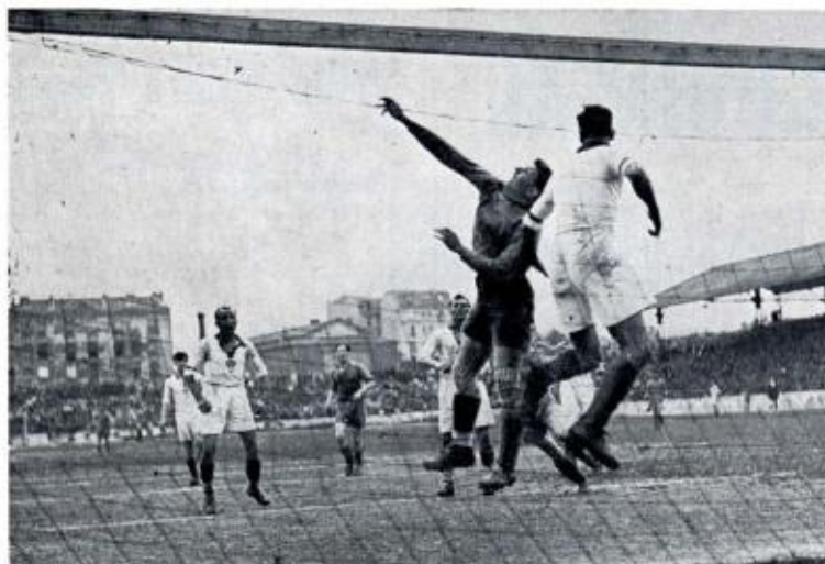
Une phase de la Finale du Championnat de France Amateur, à Saint-Ouen