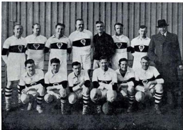
L'ÉQUIPE DES VÉTÉRANS

« Le S.C.O., l'année suivante, ramenait à Angers le titre de Champion de Division d'honneur. On allait donc connaître le bonheur sportif et, à défaut de la richesse, l'aisance qui aide au succès. »